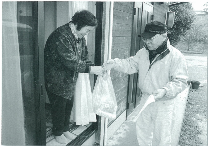
買い物を届ける会員

島根県隠岐の島町 今津老人クラブ 長生会 会員数・49名(男性・13名・女性・36名)