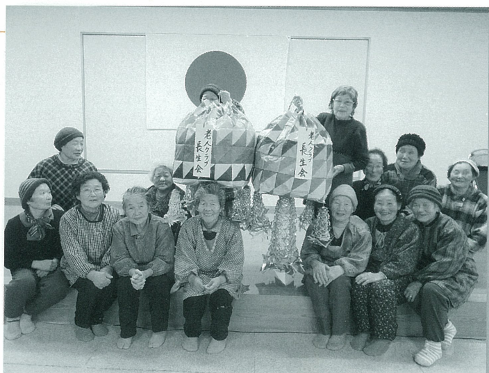
地区「とんど祭」の準備をする会員の皆さん

隠岐の島町は、島根半島の北約70キロ沖に浮かぶ隠岐諸島で最も大きな島、島後の全域で、人口約1万5千人、少子高齢化、過疎化が進む町です。