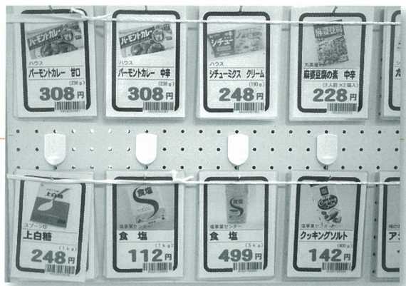
写真入り商品カード

そこで、スーパーが無料で集会所にまとめて商品を配達し、購入した方が取りに来る形に変更しました。ただ、一人暮らしの高齢者