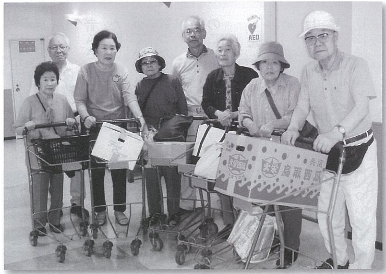
買い物を終えて、ボランティアと共に

会員の中でも一人暮らしや高齢者夫婦世帯が多くなり、日常生活で不便を感じる人が多くなったことから、平成19年に「見守り訪問グループ」を結成して、市老連にボランティア登録をしました。 活動は、話し相手となって高齢者の相談にのる「訪問グループ」、買い物や病院への付添い、屋内外の簡単な仕事をする「行動グループ」に分かれて行っています。ここでは「行動グループ」の活動を中心に報告します。 買い物は、地域に商業施設がなく、最も近いところは山の中腹のため坂道で、バス停も遠いことから不便をきたしていました。そこで毎月第一・二・四・五週の金曜日と第三木曜日を「買い物の日」と定めて、10時から12時までの2時間、近くのショッピングセンターまでボランティアの車で送迎しています。