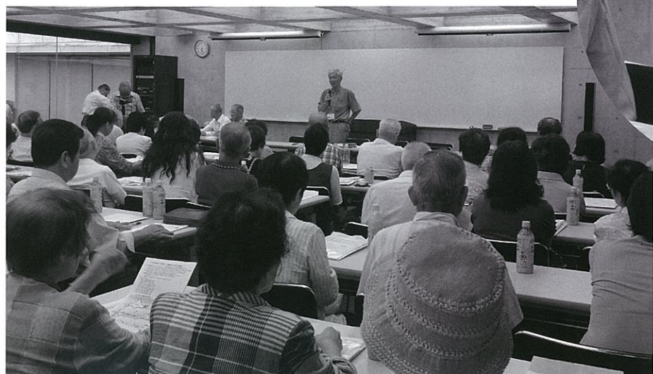
予想外に多くの市民が集まった 「空襲の体験を語り継ぐ会」