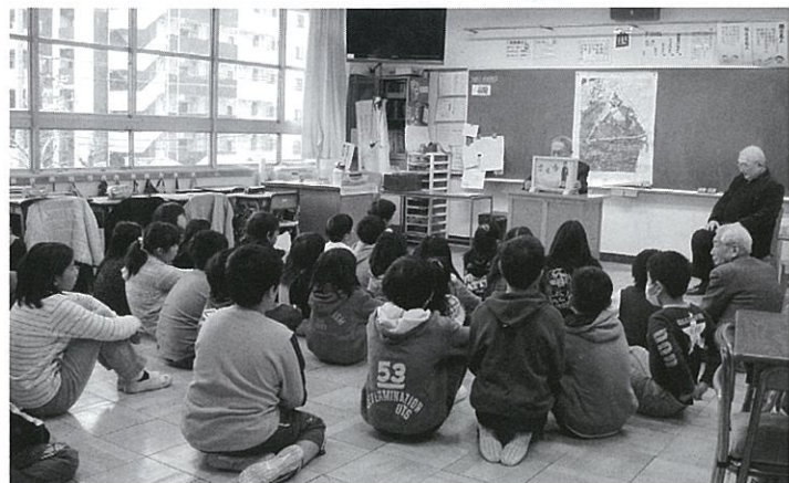
紙芝居形式で戦争体験を伝える

業の説明を行い、申し込みのあった小学校と地区の老人クラブが打ち合わせて実施しています。昨年は10校、約1900名の児童との交流が行われました。 ● アニメを使って事前学習 長い取り組みの中で、子どもたちの様子もずいぶん変わってきました。かたりの方々も子どもたちにわかりやすいように、焼失した地域を赤色で塗りつぶした地図を作成するなど、さまざまな工夫をしてきました。