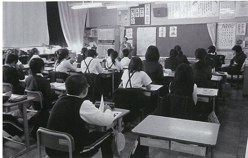
小中学校で戦争体験を語る

近年では、東京大空襲や戦争に関し、子どもたちの好きなアニメを使って事前に学習してから、かたりべの話聞くプログラムにしています。アニメの教材を使うことにより、子どもたちの集中力と関心を高め、かたりべの話