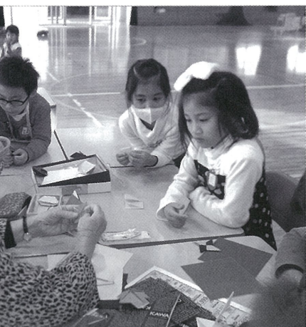
女性会員の手元を熱心に見入る子ども