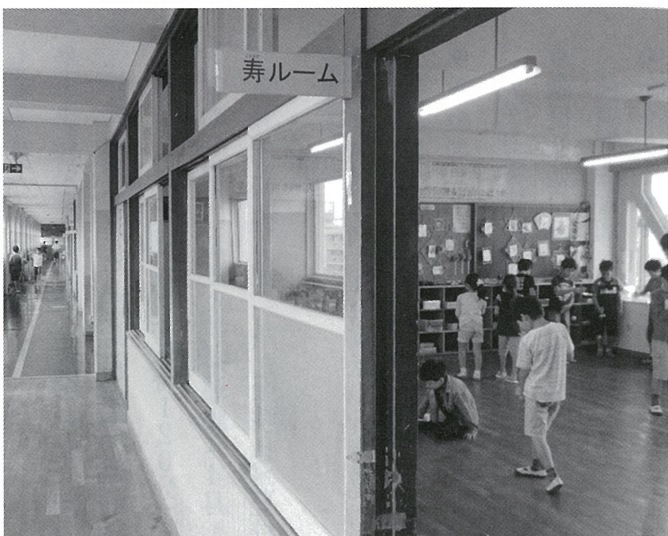
入り口には「寿ルーム」