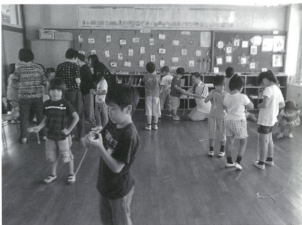
みんなで遊ぶコマ回し