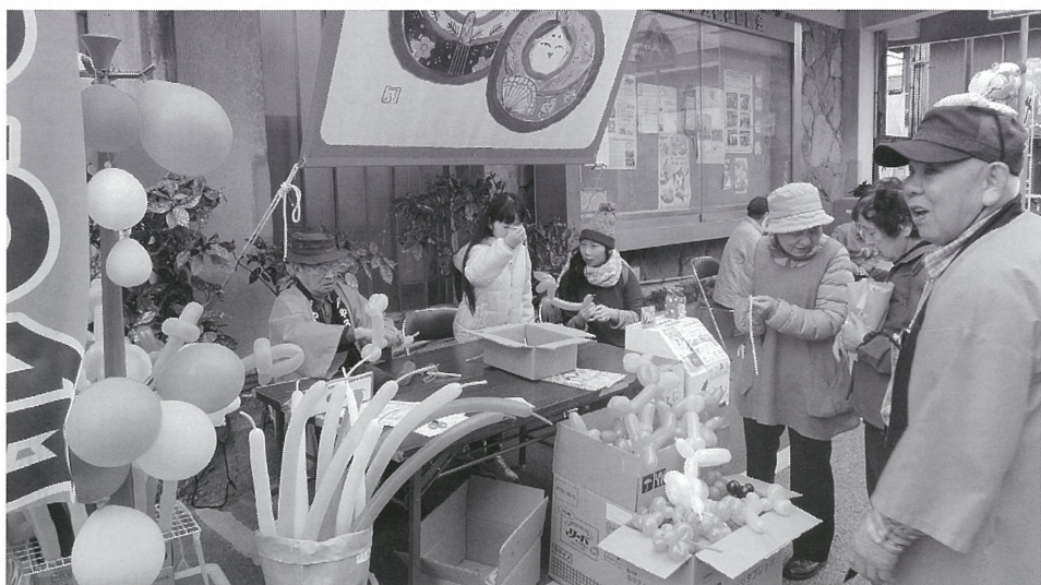
町の行事でバルーンアートに取り組む

「やろう会」は地域デビューの登竜門です。趣味や希望に沿って、他のサロンを紹介しています。料理教室、子どもの集い、町の行事への参加も呼びかけています。ギターの弾き語りで、童謡懐メロサロンを立ち上げた人もいます。夏はそうめん流し、冬は焼き芋で