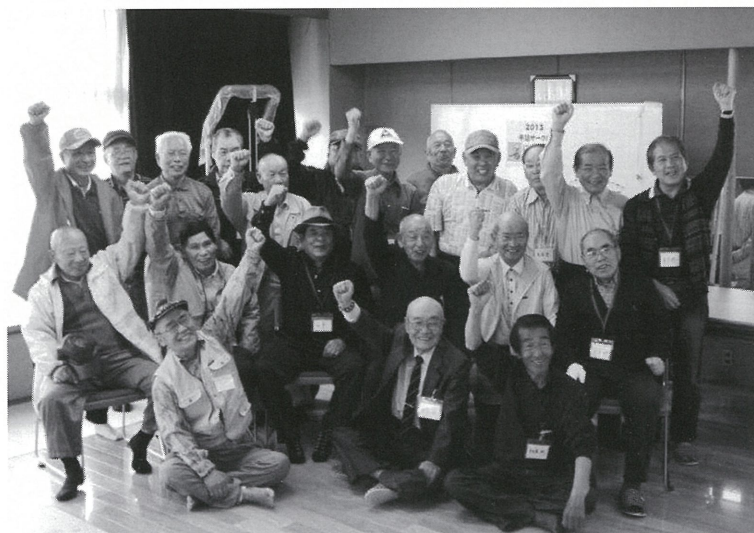
笑顔でエイエイオー!

「やろう会」も6年目になると、会えない方も出てきました。連絡の取れる方には、今でも年賀状を出しています。「あの頃が楽しかった」の一言が、我々の励みです。「あなたのおかげで友だちが出来た」など、嬉しい話も耳にします。ともかく皆が朗らかで、楽し