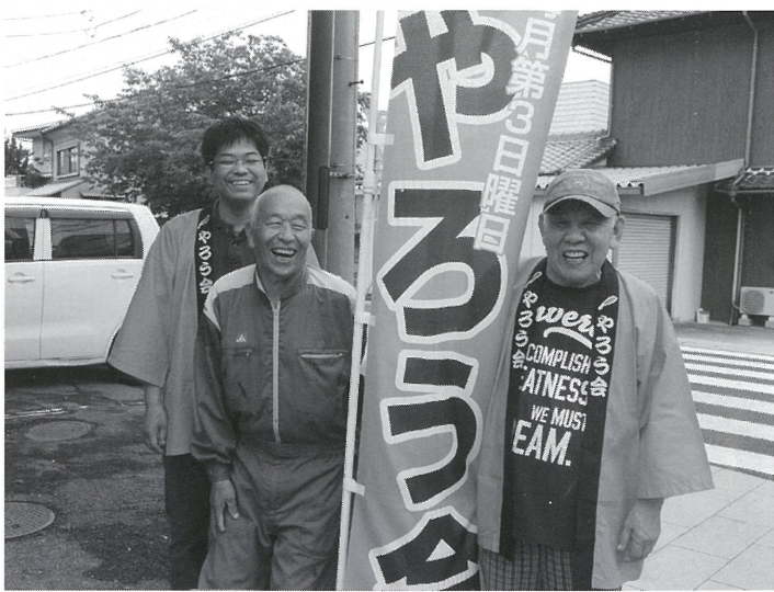
「やろう会」ののぼりと法被

広間には常時25人ほどが集まり、敷地内の別のサロンへ出かける人もいます。何よりも嬉しかったことは、皆が前向きで、明るく元気になったことです。「人のために火をともしば・我がまへあきらかなるがごとし」でした。それから赤い羽根の共同募金の助成金をいただき、我々も会費を納めて少々の茶菓子を出すようになりました。遊び道具も揃えてい