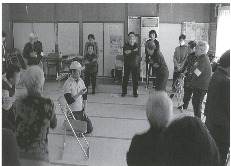
今年最後（2回目）の「体力測定」

センターからは「高齢化の高い地域だが、これからも元気で過ごされるよう一緒に活動していきたい、元気なまちづくりを目指したい」とのエールをいただいています。