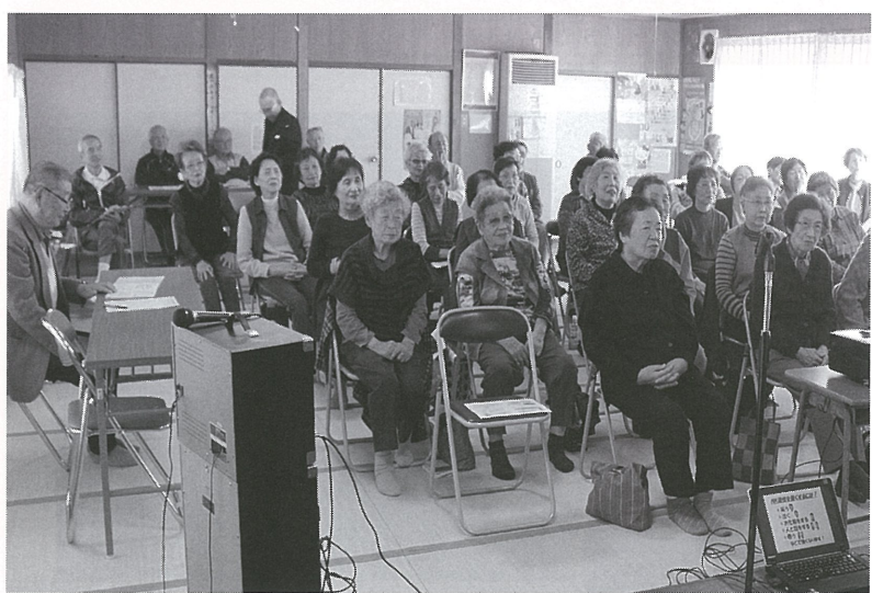
講師を招いての「免疫力アップ教室」